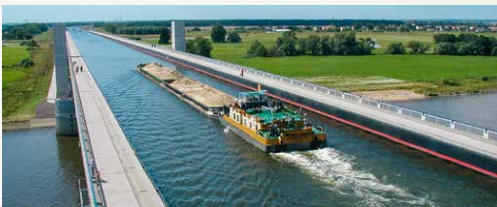
/// Haben das Anpacken gelernt: Fachkräfte in Sachsen-Anhalt, hier bei der Hafenebetrieb Aken GmbH (links). /// Die Deutsche Bahn in Sachsen-Anhalt: Verladung von Tank-Containern im kombinierten Ladungsverkehr (oben rechts). /// Prachtstück der Logistik und Ingenieurskunst: Wasserstraßenkreuz bei Magdeburg (unten rechts).

men kann. Wichtig ist auch die Strecke Hannover – Braunschweig – Magdeburg mit den Verästelungen Dessau/Lutherstadt Wittenberg und Berlin, die vor allem im Güterverkehr entscheidend sind. Zudem wird der Knotenpunkt Magdeburg ausgebaut und leistungsfähiger gemacht, genau wie Dessau und Roßlau. Wir werden außerdem auf der Strecke Magdeburg – Halle (Saale) den Knoten Köthen modernisieren. Die Neubaustrecke Halle/Leipzig/Erfurt wird Ende 2015 fertig sein. Sachsen-Anhalt wird bis 2030 eines der besten Eisenbahnnetze Europas haben.