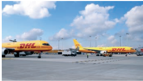
Magdeburger Hafen, der größte Binnenhafen Ostdeutschlands DHL-Luftfrachtdrehkreuz am Flughafen Leipzig/Halle