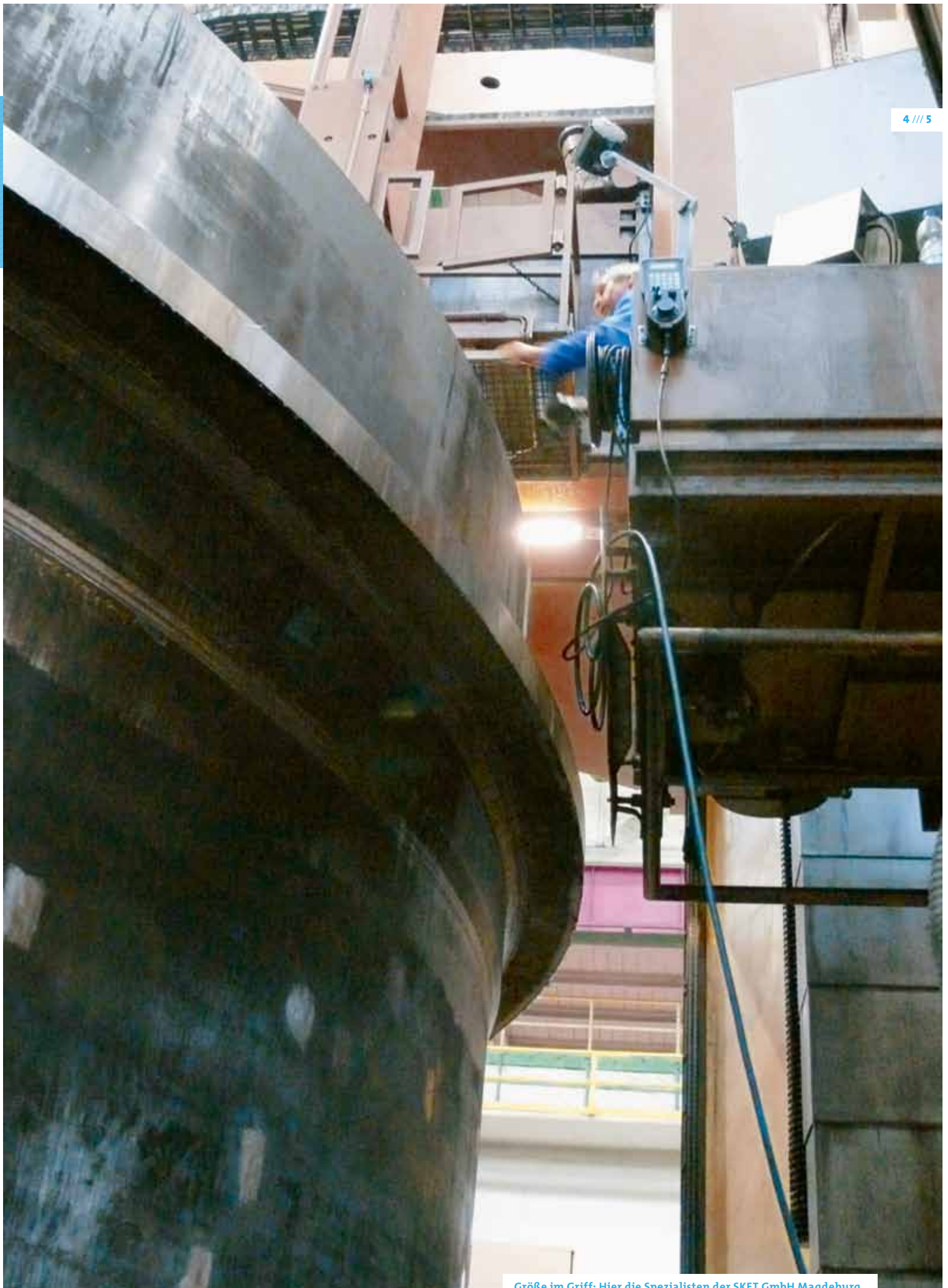
Größe im Griff: Hier die Spezialisten der SKET GmbH Magdeburg.