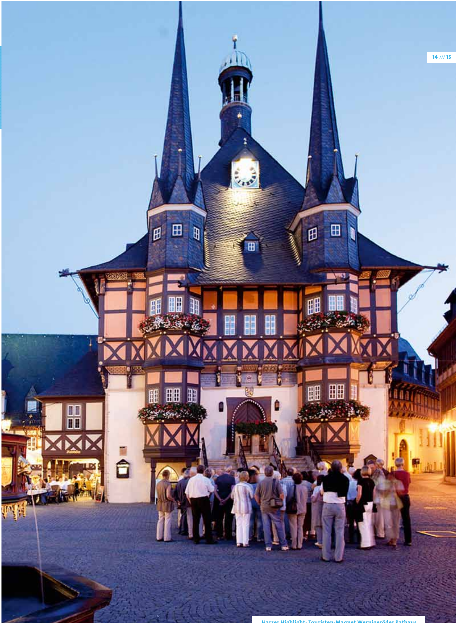
Harzer Highlight: Touristen-Magnet Wernigeröder Rathaus.